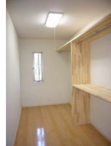
■ウォークインクローゼット